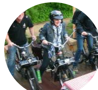
Challenge solex 7