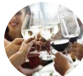
Autour du vin 8