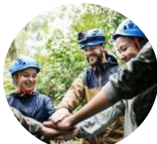
Challenge sportifs 3