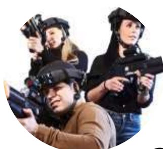
Laser Game 9